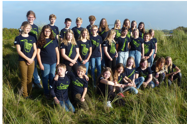
Gestaltung: E. Möllmann